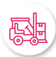
CHARIOTS AUTOMOTEURS DE MANUTENTION À CONDUCTEUR PORTÉ