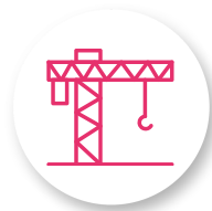
GRUES À TOUR

L'attestation d'absence de contre-indications médicales à la conduite, valable 5 ans, est délivrée pour les engins suivants :