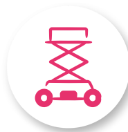
PLATES-FORMES ÉLEVATRICES MOBILES DE PERSONNES