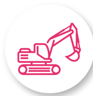
ENGINS DE CHANTIER TÉLÉCOMMANDÉS OU À CONDUCTEUR PORTÉ